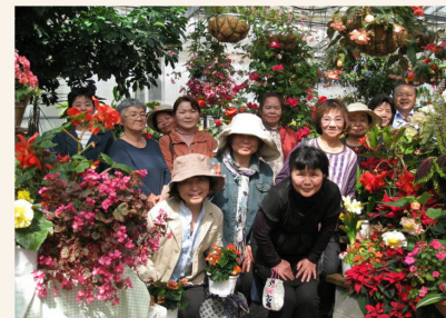
介護者リフレッシュ旅行