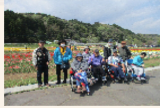
チューリップフェスタ